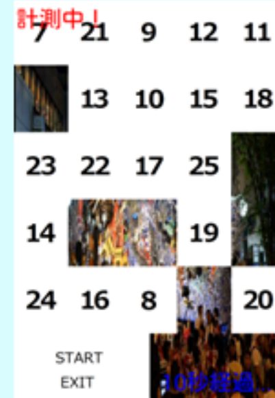
「ナンバープッシュ」

1~25までの数字を1から順番に押していくというシンプルなゲーム。時間計測があり、タイムが表示される。最短記録を目指そう!