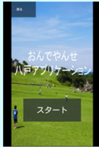
パンフレット機能

八戸を探検しているような気分になってほしいという思いから「クエスト」、そこに「八戸」という言葉を用いて名づけたアプリケーションです。