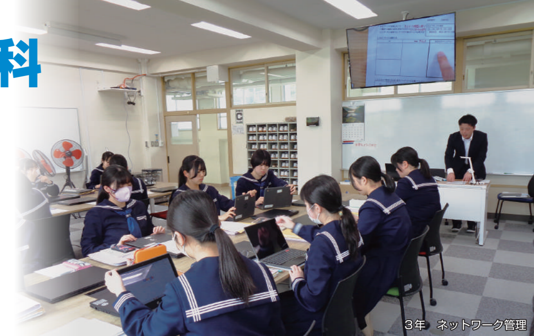
3年 ネットワーク管理

IT 技術を使って、地域課題の解決に挑戦し、郷土愛を育み、地域の即戦力となる人材育成を目指します。