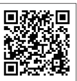
情報処理科 課題研究の取り組み